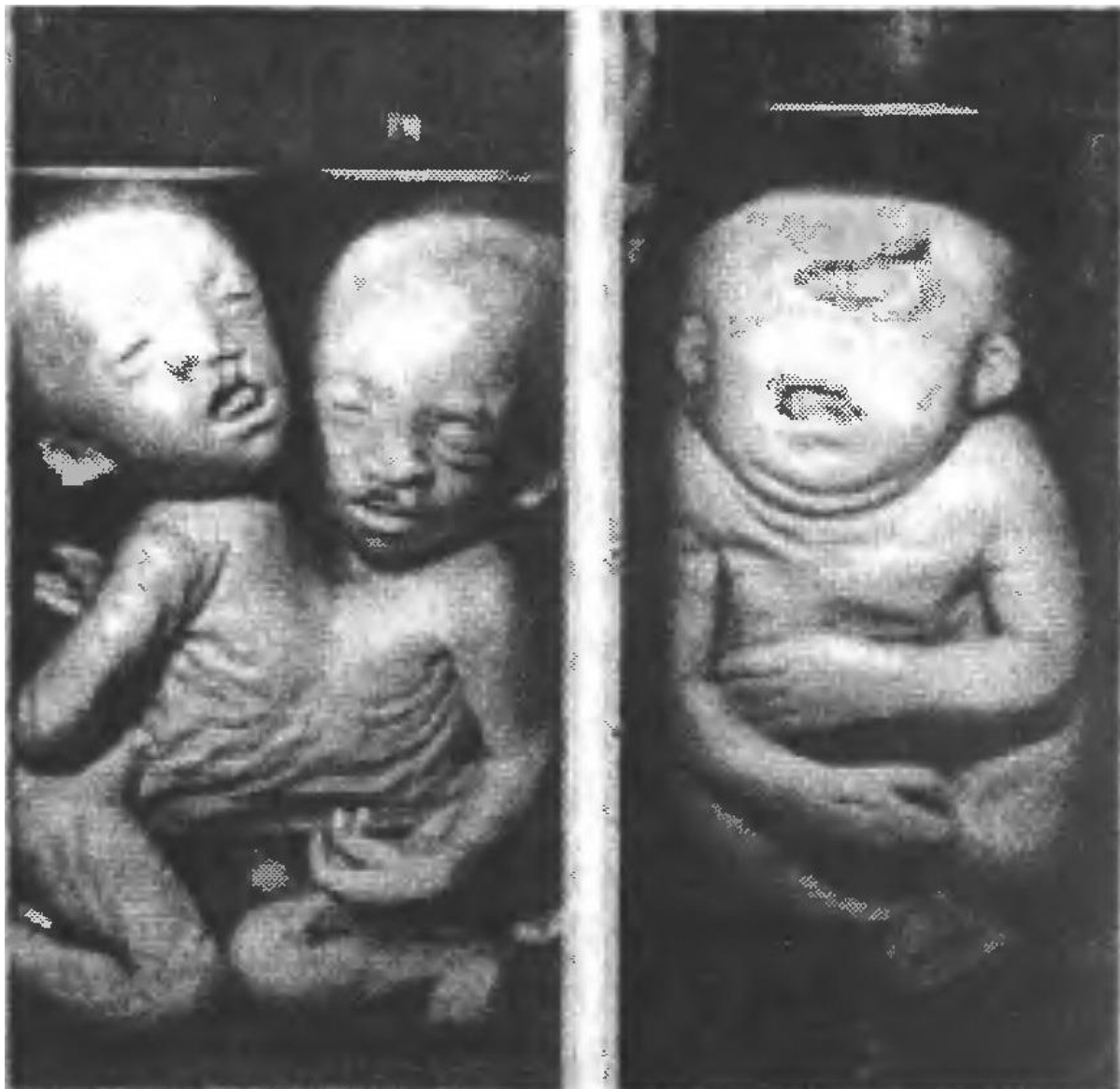
3 paveikslas. Būsimieji gimdytojai, ar norite kad jums taip atsitiktų?

motinų vaikų vytimasis ženkliai skyrėsi nuo negeriančių. Visi jie gimė mažesnio ūgio ir svorio, buvo silpniau išsivysčiusios galūnės, lėčiau augo, ne taip aktyviai judėjo ir visi turėjo, tiesa nevienodo laipsnio, «alkoholinį vaisiaus sindromą».